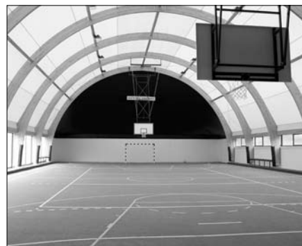
Tak będzie wyglądać hala, która powstanie na naszym Osiedlu.

projektowe. W czerwcu przyszłego roku hala sportowa na naszym osiedlu ma być gotowa. Nowy obiekt automatycznie zapewni instalację monitoringu. Gimnazjum nr 4 jest najbliższe montażu kamer zapewniających bezpieczeństwo. Także pozostałe szkoły podstawowe nr 12 i 37 oraz gimnazjum nr 5 mają szansę. Z przeprowadzonego przeze mnie sondażu wynika, że Rady Rodziców wszystkich tych placówek oświatowych skromnie, ale wesprą finansowo zakup kamer. Ta deklaracja ułatwi zabiegi u władz miasta o pokrycie kosztów monitoringu. Liczne przykłady dewastacji na osiedlu czynią kupno kamer zarówno dla budynków szkolnych jak i boisk sportowych sprawą priorytetową.